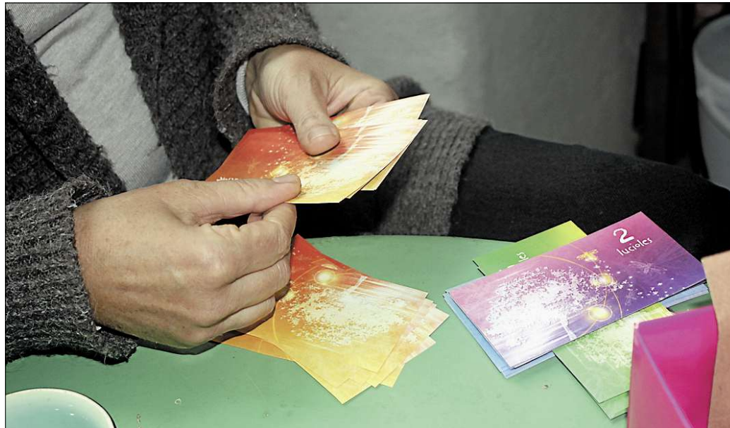
Des billets colorés pour faire ses emplettes chez les commerçants partenaires.